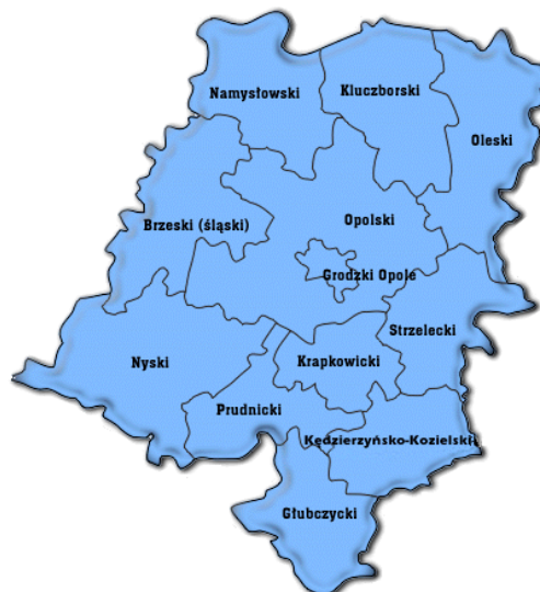
Mapa: województwo opolskie

Województwo: Opolskie Powiat oleski Gmina: Zębowice Sołectwo: Radawie